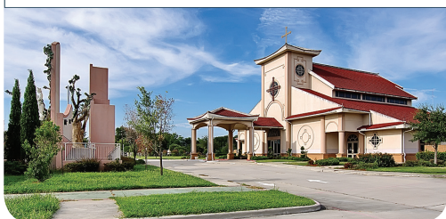
GIÁO XỨ ĐỨC MẸ LA VANG - WWW.LAVANGCHURCH.ORG